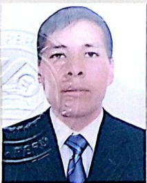
Registro Libro 34-A Folio 4826

Dado y firmado en Ñaña, Lima con fecha veinticuatro de enero del 2018