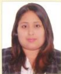
Registro Libro 31-A Folio 4159

Dado y firmado en Ñaña, Lima con fecha diecinueve de enero del 2017