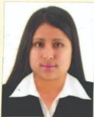
Registro Libro 22-B Folio 3095

Dado y firmado en Ñaña, Lima con fecha siete de mayo del 2018