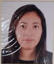
Registro Libro 23-B Folio 3237

Dado y firmado en Ñaña, Lima con fecha dos de octubre del 2018