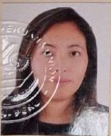
Registro Libro 33-A Folio 4554

Dado y firmado en Ñaña, Lima con fecha veinticuatro de enero del 2018