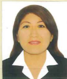
Registro Libro 23-B Folio 3216

Dado y firmado en Ñaña, Lima con fecha dos de octubre del 2018