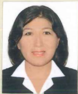
Registro Libro N° 26-A Folio 2903

Dado y firmado en Ñaña, Lima a los Veinte días de Mayo del 2015