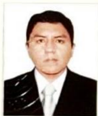
Registro Libro N° 15-B Folio 2169

Dado y firmado en Ñaña, Lima a los Veintitrés días de Octubre del 2013