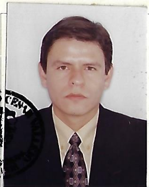
Registrado en el libro respectivo A fojas 56 bajo el N° 14