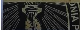
Secretario de la Facultad