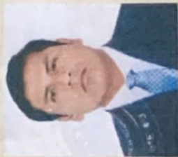
Registro Libro 34-A Follo 4845

Dado y firmado en Ñaña, Lima con fecha veinticuatro de enero del 2018.