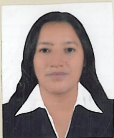
Registro Libro 28-A Folio 3136

Dado y firmado en Ñaña, Lima con fecha seis de enero del 2016